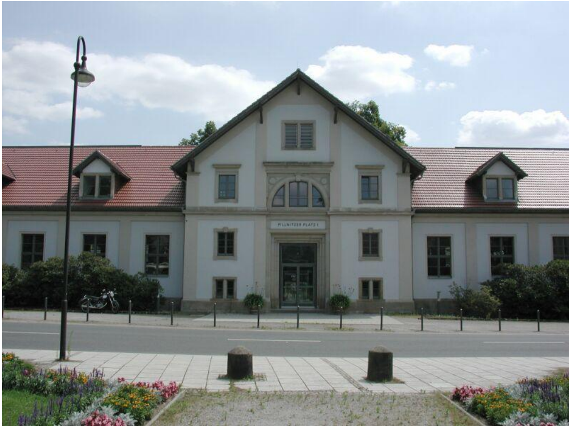
Gebäude der Hochschule für Wissenschaft und Technik Dresden, Fachbereich Landbau/ Landespflege am Pillnitzer Platz