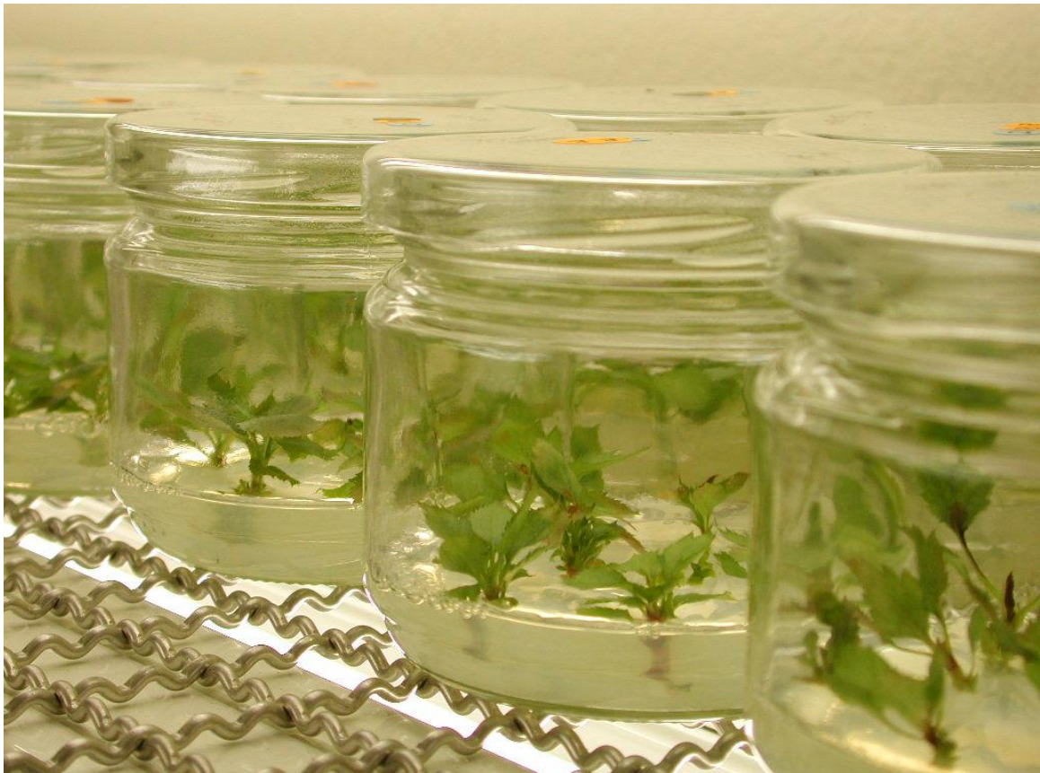
In-Vitro-Kulturen bei Apfel (Wild HTW)