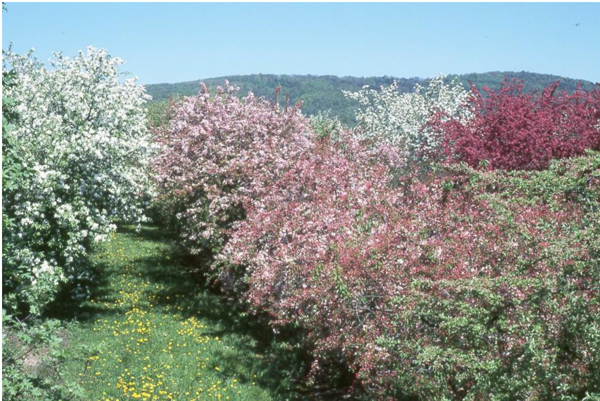
Flächen der Genbank Obst