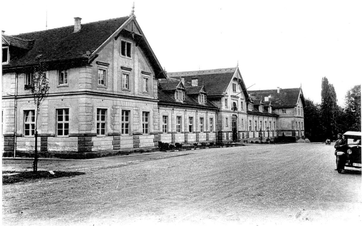
Bild vom Schulgebäude der höheren Lehranstalt von vermutlich 1920. ( Wild HTW)