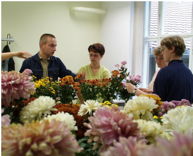
Haltbarkeitsversuch bei Schnittblumen

Die Fortbildung zum Techniker dauert 2 Jahre und die Fortbildung zum Wirtschaftler 1 Jahr. Zugangsvoraussetzung ist die abgeschlossene Berufsausbildung und 1 Jahr Praxis für die Fortbildung zum Techniker. Die Zulassung zur berufsständigen Meisterprüfung erfordert 3 Praxisjahre. Alle Meisterinnen und Meister sowie Technikerinnen und Techniker erwerben die Berechtigung zum Ausbilden des gärtnerischen Nachwuchses. In allen Ausbildungsrichtungen wird anhand von praxisnahen Aufgaben das erworbene theoretische Wissen angewendet. An dieser Stelle sind besonders die fächerübergreifenden Projektarbeiten zu erwähnen. In diesen Projektarbeiten werden komplexe Aufgabenstellungen aus der Praxis fächerübergreifend und mit hoher Selbständigkeit der Fachschülerinnen und Fachschüler bearbeitet. So werden z. B. alle Aufgaben von der Planung bis zur betriebswirtschaftlichen Auswertung, vom Aufmaß bis zur Leistungsbeschreibung an einem Projekt, z. B. einem Hausgarten, bearbeitet.