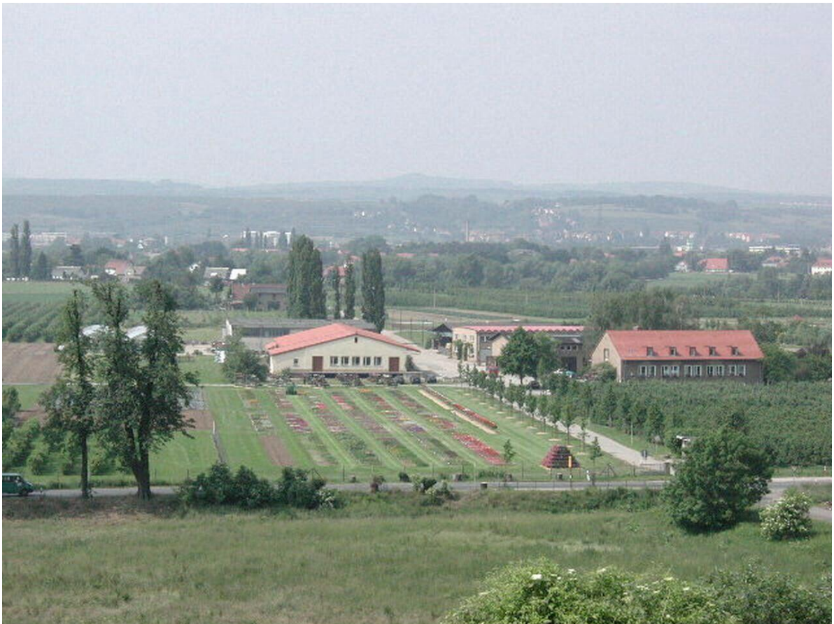
Versuchsfeld des Fachbereichs Gartenbau und Landespflege der Sächsischen Landesanstalt für Landwirtschaft