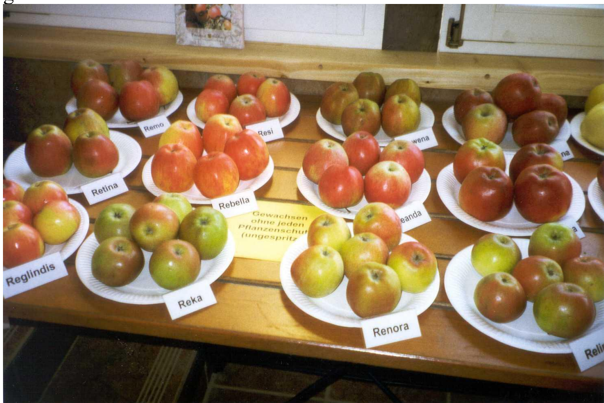
Ergebnis der Prüfung resistenter Apfelsorten ein Jahr ohne Fungizidanwendung

bei der Bewahrung alter deutscher Sorten und heimischer Wildobstsorten dienen die Genbankbestände vor allem als Grundlage und Ausgangsmaterial für die Obstzüchtung. Besondere Bedeutung kommt dabei in heutiger Zeit dem Auffinden und der Erhaltung von Sorten zu, die bestimmte Resistenzen tragen. Insbesondere wird u.a. gearbeitet an Problemen der Schorf-, Mehltau- und Feuerbrandresistenz bei Apfel und Birne, an der Auffindung von Resistenzträgern für Valsa- und Rindenbrandresistenz bei Süßkirsche, für Scharkaresistenz bei Pflaume, für Moniliaresistenz bei Sauerkirsche und für Mehltau- und Botrytisresistenz bei Erdbeere, um nur einiges zu nennen. Wesentliche Ergebnisse zum Resistenzverhalten von Sorten konnten erzielt werden, nachdem zeitweilig auf Pflanzenschutzmaßnahmen gänzlich verzichtet worden ist.