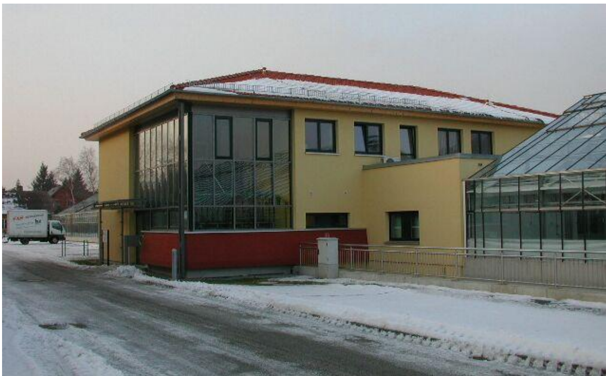
Funktionsgebäude der BAZ, Institut für Obstzüchtung Pillnitz in der neuen Gewächshausanlage