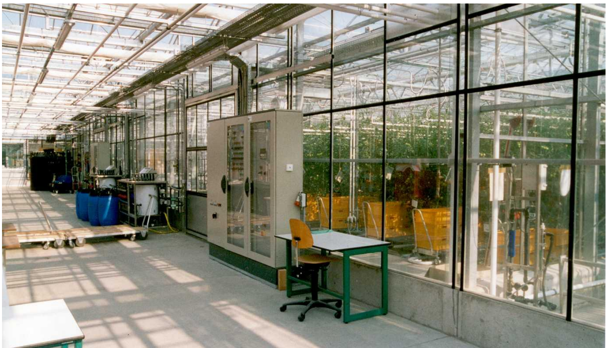
Blick in die neuen Versuchsgewächshäuser