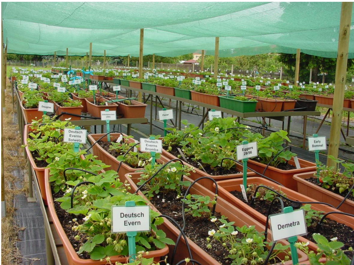
Erhaltung der genetischen Ressourcen bei Erdbeeren