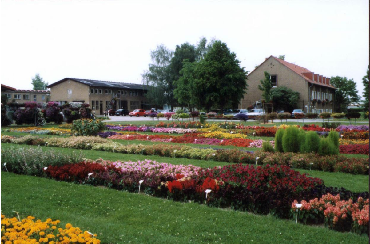
Versuchsfeld mit Demofläche für Sichtung Beet - u. Balkonpflanzen (Bär LfL)