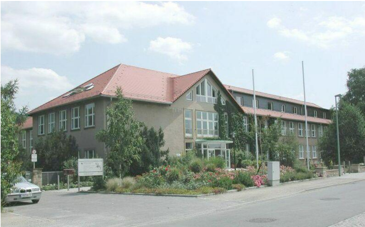
Fachschule für Gartenbau/ Technik und Sitz der Leitung des FB 7