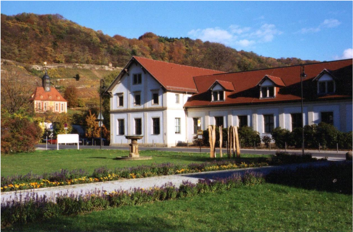
Gebäude der HTW Dresden mit Blick auf Weinberg und Weinbergskirche (Bär LfL)