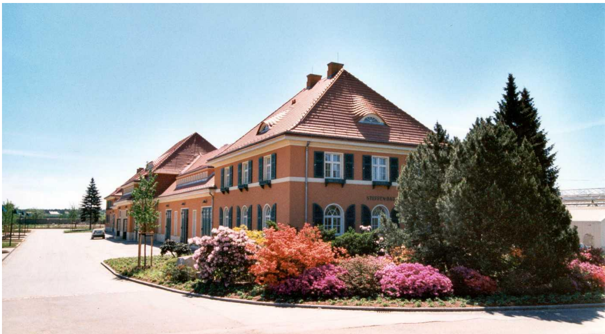
Blick auf den rekonstruierten Steffenbau