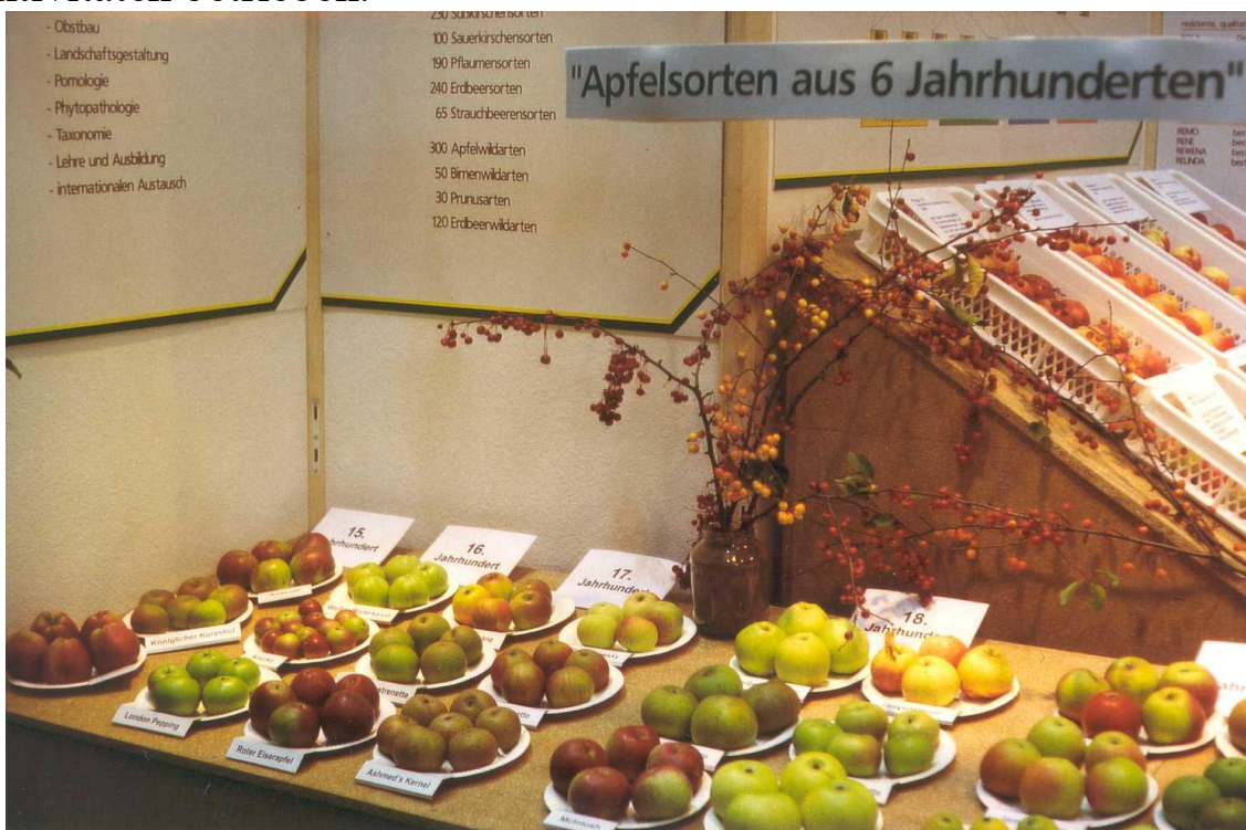
Werbung für genetische Vielfalt in zahlreichen Ausstellungen

Weiterhin begleiten wir Projekte von Sortensammlungen auf regionaler Ebene, Streuobstprojekte und ähnliche Vorhaben. Es konnten bereits von mehreren Standorten als echt erkannte einheimische Wildobstarten (Holzapfel, Malus sylvestris , und Holzbirne, Pyrus pyraster ) gesammelt und in die Pillnitzer Sortimente aufgenommen werden. Sie dienen heute als Ausgangsmaterial zur Aufpflanzung forstlicher Samenspenderanlagen zur Wiedereinbringung einheimischer Obstarten in Aufforstungen. Eine Erfassung solitärer, schützenswerter uralter Obstgehölze in Nord- und Ostdeutschland wird als Unterstützung bestimmter Naturschutz- und landespflegerischer Aktivitäten betrieben.