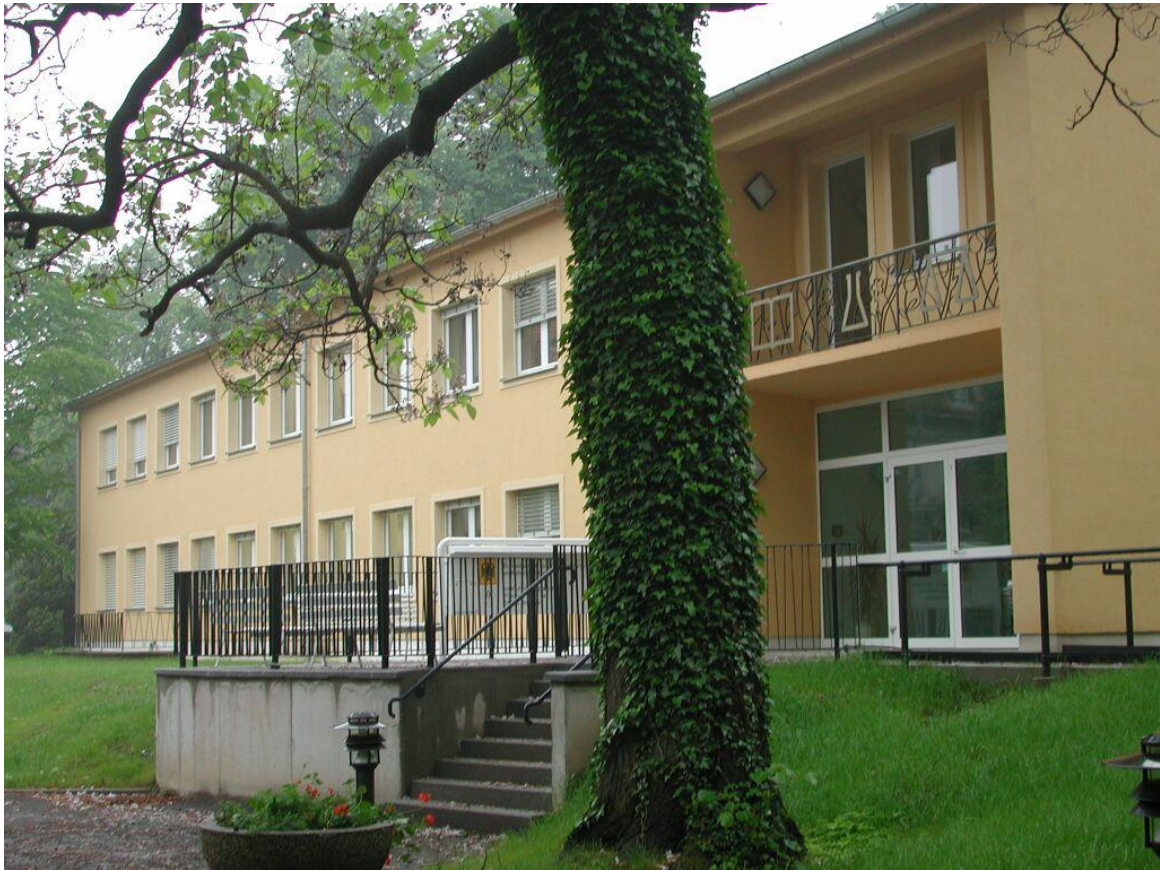
Laborgebäude der BAZ, Institut für Obstzüchtung Pillnitz