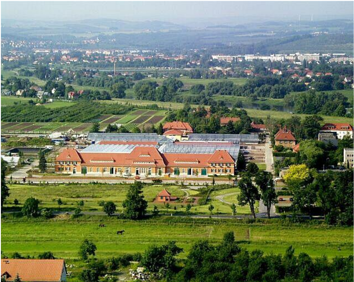
Blick auf die neue Gewächshausanlage an historischer Stelle mit Steffenbau als Sitz der Überbetrieblichen Ausbildung für den Beruf Gärtner im Freistaat Sachsen