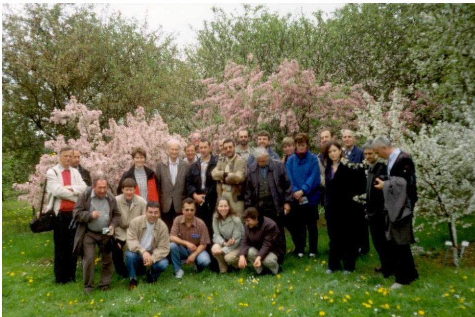
Internationale Tagung der Malus/Pyrus Arbeitsgruppe im Mai 2002 in Pillnitz im Rahmen des EC/PGR-Programms zur Koordinierung der Erhaltung pflanzen-genetischer Ressourcen in Europa

Die Genbank Obst ist maßgeblich an der Erstellung europäischer Datenbanken für Kernobst, Steinobst und Erdbeere beteiligt und führt das Bundes-Obstarten-Sortenverzeichnis, welches alle Obstsorten in Bundes- und Landesinstituten sowie von einigen nichtstaatlichen Organisationen enthält. Zur Zeit (4. Auflage: 2000) sind darin über 17.000 Nachweise von 5.700 Obstsorten aus 45 Obstarten enthalten, darunter von 2.700 Apfelsorten, 830 Birnen- und 430 Süßkirschsorten, die in Deutschland vorkommen. Damit dürfte die genetische Vielfalt bei Obst für längere Zeit in Deutschland gesichert sein. Eine wichtige Aufgabe ist es, diesen erfreulichen Zustand zu erhalten und zu befördern. Die Daten sind über das Internet abrufbar.