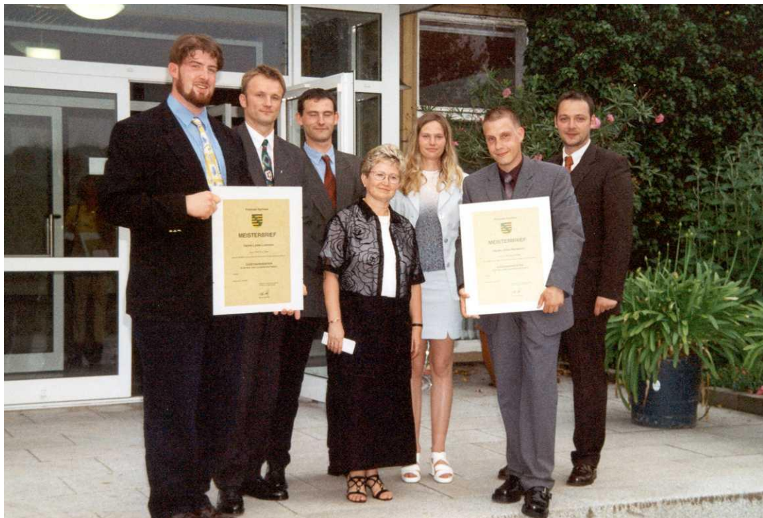
Wirtschaftler/ Meister Garten- u. Landschaftsbau: von links nach rechts