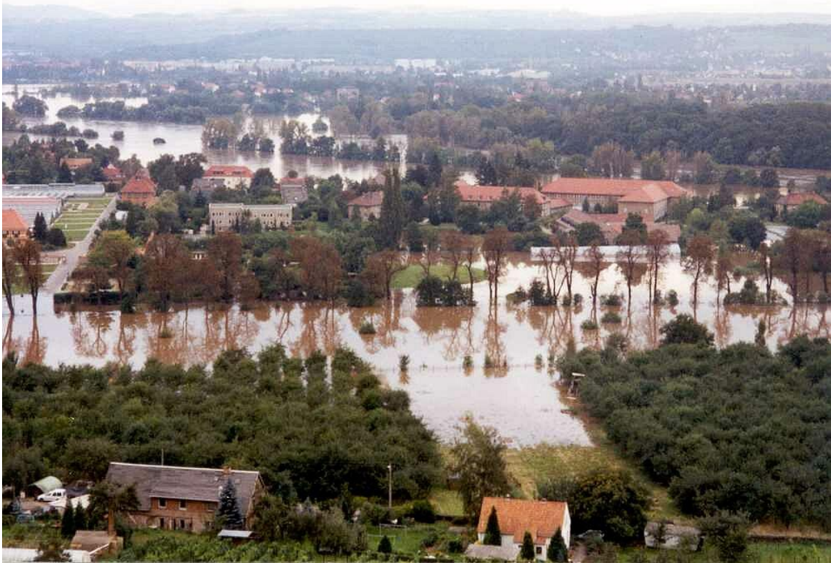
Blick vom Elbhang auf Lohmener Str. und Fachschule

Glücklicherweise sind in der Landesanstalt insgesamt wesentlich weniger Schäden eingetroffen als vielfach und nach den bekannten Bildern befürchtet wurde.