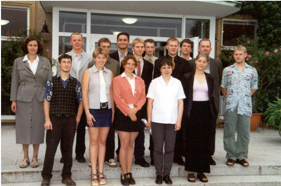
Techniker Garten- u. Landschaftsbau: von links nach rechts