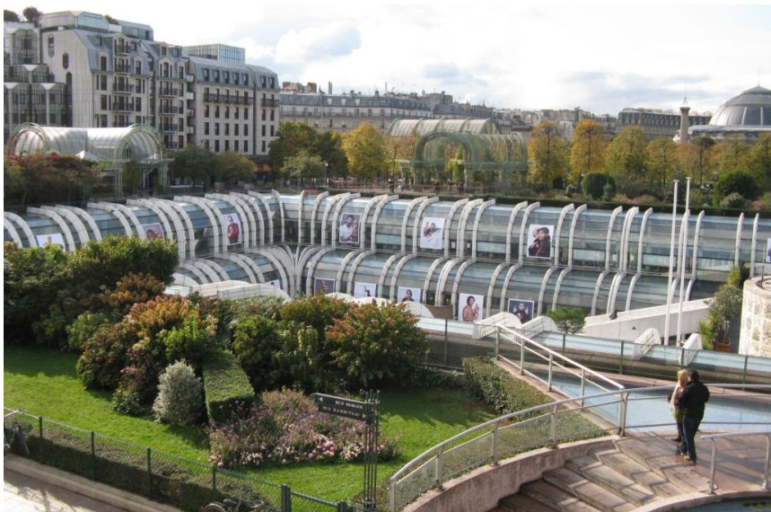
Les Halles - ein etwas in die Jahre gekommenes Einkaufszentrum