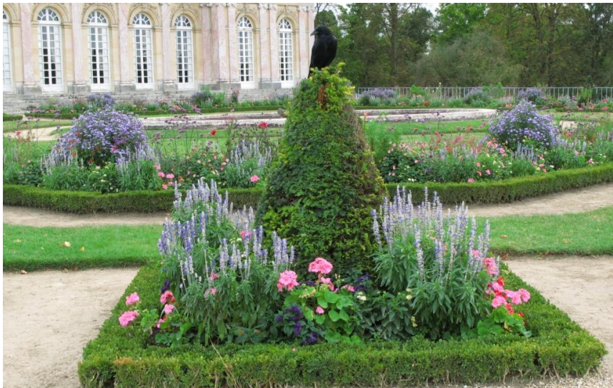
Grand Trianon – Versailles

Nach dem Mittagessen führen wir mit zwei Bussen nach Versailles. Das ist nicht weit von Tecomah entfernt. Für einen kurzen Blick in diesen berühmten Park hatten wir noch etwa eine Stunde Zeit. Interessant ist, dass es möglich ist, mit dem Auto zu einzelnen Bereichen innerhalb des riesigen Areals zu fahren. Unser Schwerpunkt war das Grand Trianon, das im Wesentlichen von Marie-Antoinette, der Frau Ludwigs des XVI. ausgestattet und genutzt wurde. Der Gartenbereich ist gerade renoviert worden und es waren üppige Stauden- und Sommerflore zu bestaunen. Anschließend unternahmen wir eine kleine Stadtrundfahrt durch Paris und fuhren mit der RER, der S-Bahn, zum Triumphbogen. Gleich um die Ecke befindet sich die Pariser Industrie- und Handelskammer. Für uns und für zahlreiche andere junge Gäste aus dem europäischen Ausland gab es dort einen Galaempfang.