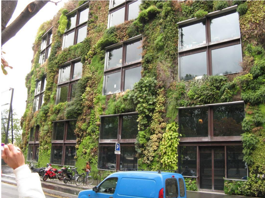
Exotische Pflanzwand von Patrick Blanc

Das Verwaltungsgebäude des Museums ist mit einer 800 m 2 umfassenden Fassadenbegrünung versehen, die aus 15.000 Einzelpflanzen mit 150 verschiedenen Arten aus aller Welt besteht. Planer ist der Botaniker und Gartenkünstler Patrick Blanc . Ein leichter Regen ließ uns Schutz suchen. Auf der überdachten Terrasse der Museumscafeteria schrieben einige von uns die obligatorischen Ansichtskarten.