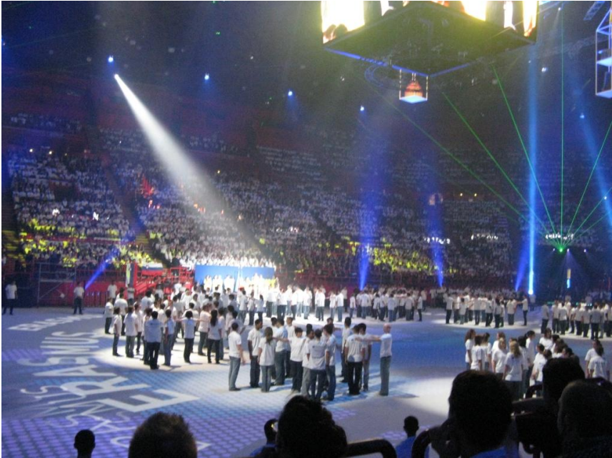
Aufmarsch der Vertreter der TECOMAH

Er begann seine berufliche Laufbahn ebenfalls als Lehrling. Er begrüßte das Publikum: „Zukünftige Kaufleute, Handwerker, Ingenieure und Unternehmensführer“. Es wäre die reale Wirtschaft, die konkrete Wirtschaft, die sich heute versammelt hat. Die alltägliche Wirtschaft, die Wirtschaft der Nähe und die Wirtschaft von der Hausecke. Anschließend berichtet ein Jungkoch, wie er selbstverständlich nach der Ausbildung ins Ausland gegangen ist, um dort sein Wissen zu erweitern.