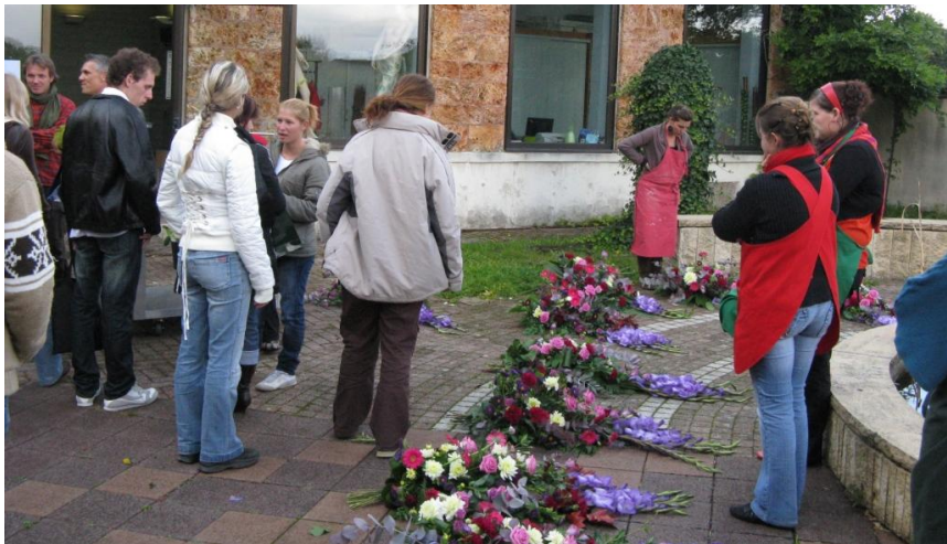
Besuch bei den Floristen mit der ungarischen Gruppe