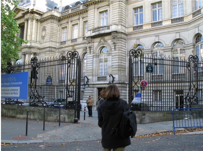
Industrie- und Handelskammer zu Paris

In der Halle trafen sich Auszubildende aus den verschiedenen Berufsbranchen, wie z.B. Mediengestalter, Buchbinder und junge Leute aus der Automobilbranche. Die Auszubildenden kamen unter anderem aus Portugal, Schweden, Spanien, Frankreich, Deutschland, Polen und aus Ungarn.