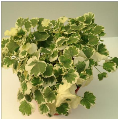
Abbildung 1 'Madame Salleron', eine Blattschmuckpelargonie mit weißem Blattrand