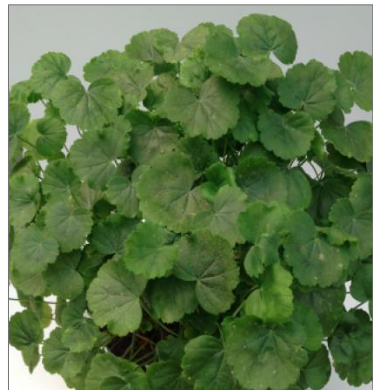
Abbildung 2 Grünlaubige Mutation von 'Madame Salleron'

Ein in der Züchtungsgeschichte bekanntes und gut beschriebenes Beispiel ist die Entstehung der Sorte 'Madame Salleron' (Abb.1). Eine grünlaubige und hochwüchsige Pelargonium zonale fothergillii tauchte um 1830 in England auf (Beschreibung bei Bergann,F. und Bergann,L. 1959). Aus ihr entstand in zwei Mutationsschritten die kleinwüchsige und weißrandige 'Madame Salleron' (um 1877).