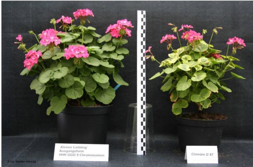
Abbildung 3: Pelargonium x hortorum 'Kleiner Liebling' (links Ausgangsform), rechts eine Mutante mit gestörter Chlorophyllsynthese in der L2 (zweite Schicht, aus der die Blattbildung erfolgt).

'Madame Salleron' trat ihren Siegeszug in den Parkanlagen des 19. Jahrhunderts an. Sie ist eine reine Blattschmuckpelargonie. In der Pelargoniensammlung ist wieder eine stabile grünlaubige Mutation von 'Madame Salleron' aufgetaucht (Abb.2), wir interpretieren das als Rückmutation.