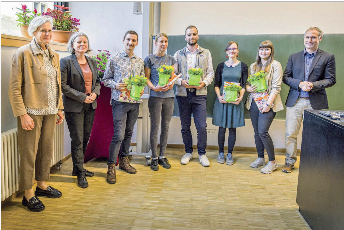
Gruppenbild der besten Absolventen des Jahrgangs.