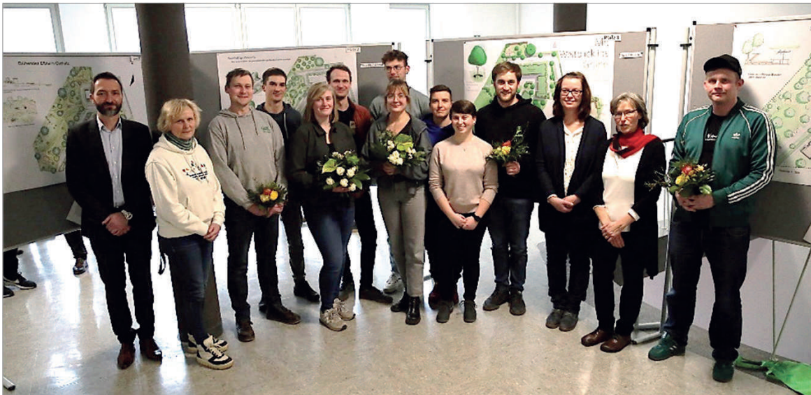
Alle Teilnehmenden des Ideenwettbewerbs der Technikerklasse GaLaBau 2022