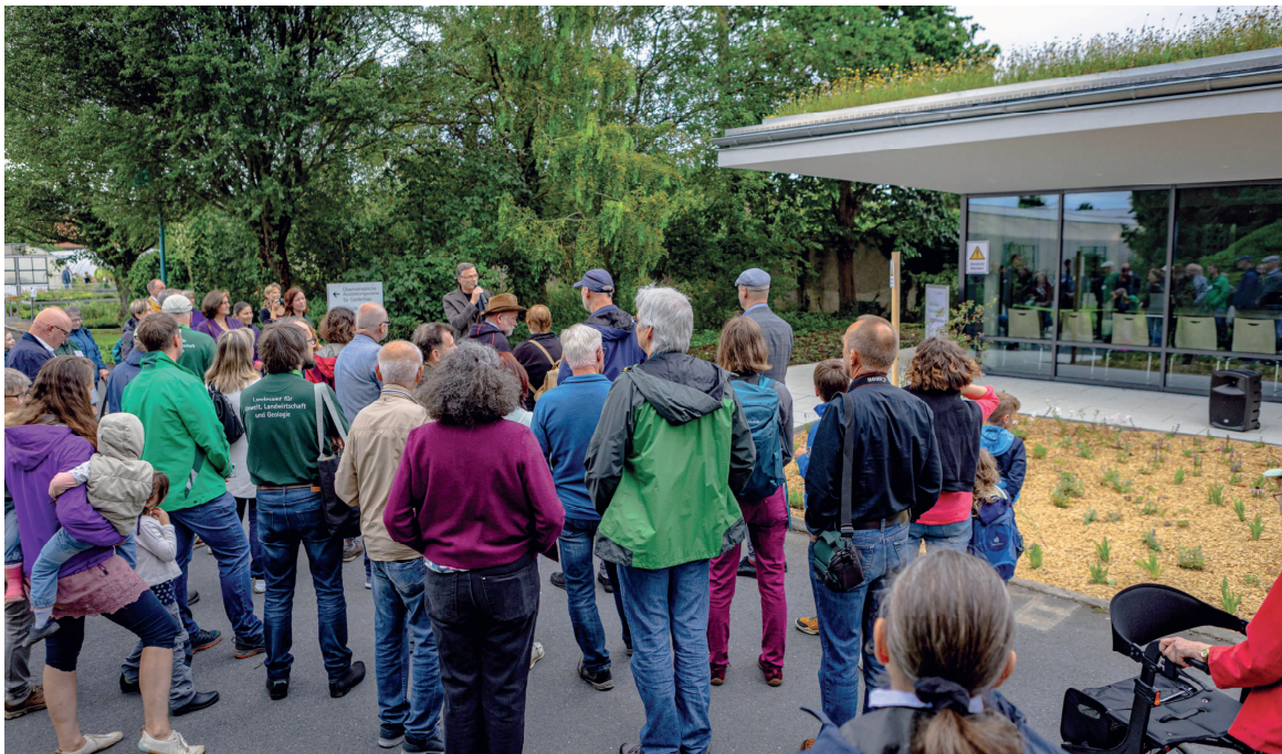
Eröffnung des Insektenzentrums der Sächsischen Gartenakademie.

Ein weiteres Highlight war die Eröffnung des Insektenzentrums der Sächsischen Gartenakademie durch den Präsidenten des LfULG Heinz Bernd Bettig.