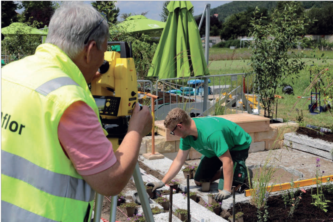
„Landschaftsgärtner-Cup Sachsen“, Foto: Friebe, LfULG

Ein weiteres Highlight war die Eröffnung des Insektenzentrums der Sächsischen Gartenakademie durch den Präsidenten des LfULG Heinz Bernd Bettig.